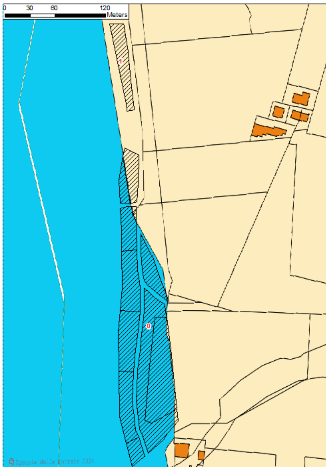
Figura 2: planimetria catastale Id09 agg